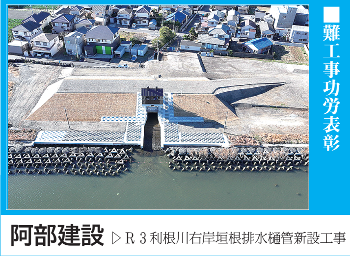
阿部建設 ▷ R3利根川右岸垣根排水樋管新設工事