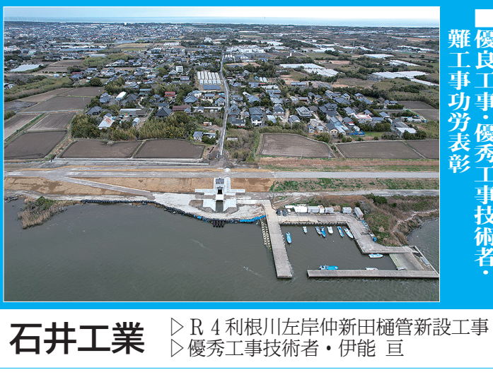
石井工業 ▷ R4利根川左岸仲新田樋管新設工事 ▷ 優秀工事技術者・伊能 亘