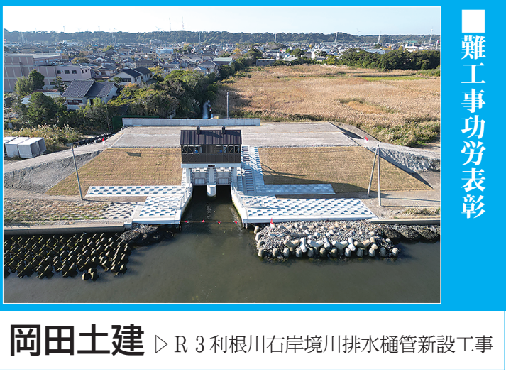
岡田土建 ▷ R3利根川右岸境川排水樋管新設工事