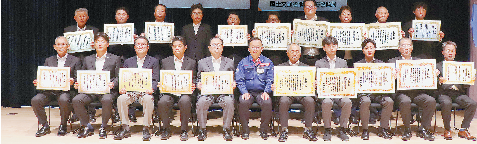
小淵所長（中央）を囲んで記念撮影